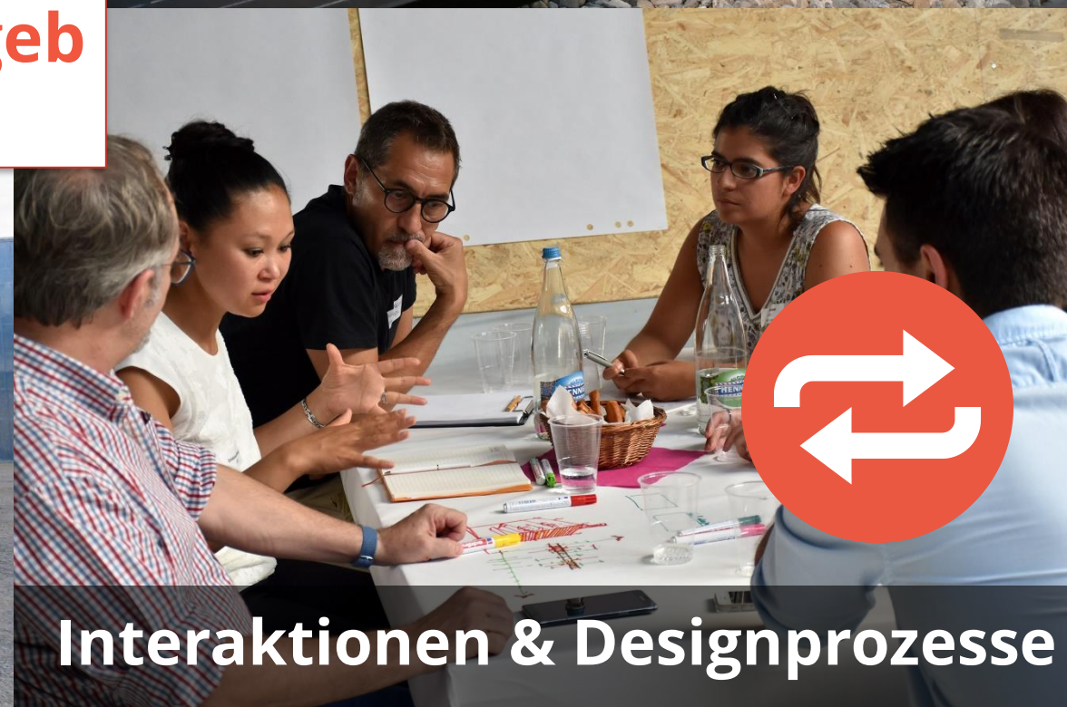
Interaktionen & Designprozesse