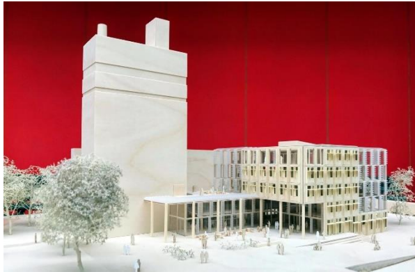
Building of the smart living lab