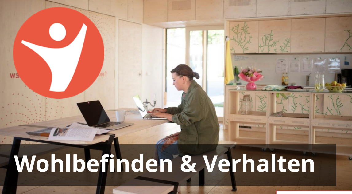
Wohlbefinden & Verhalten