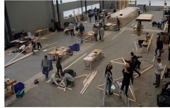
Atelier pop up